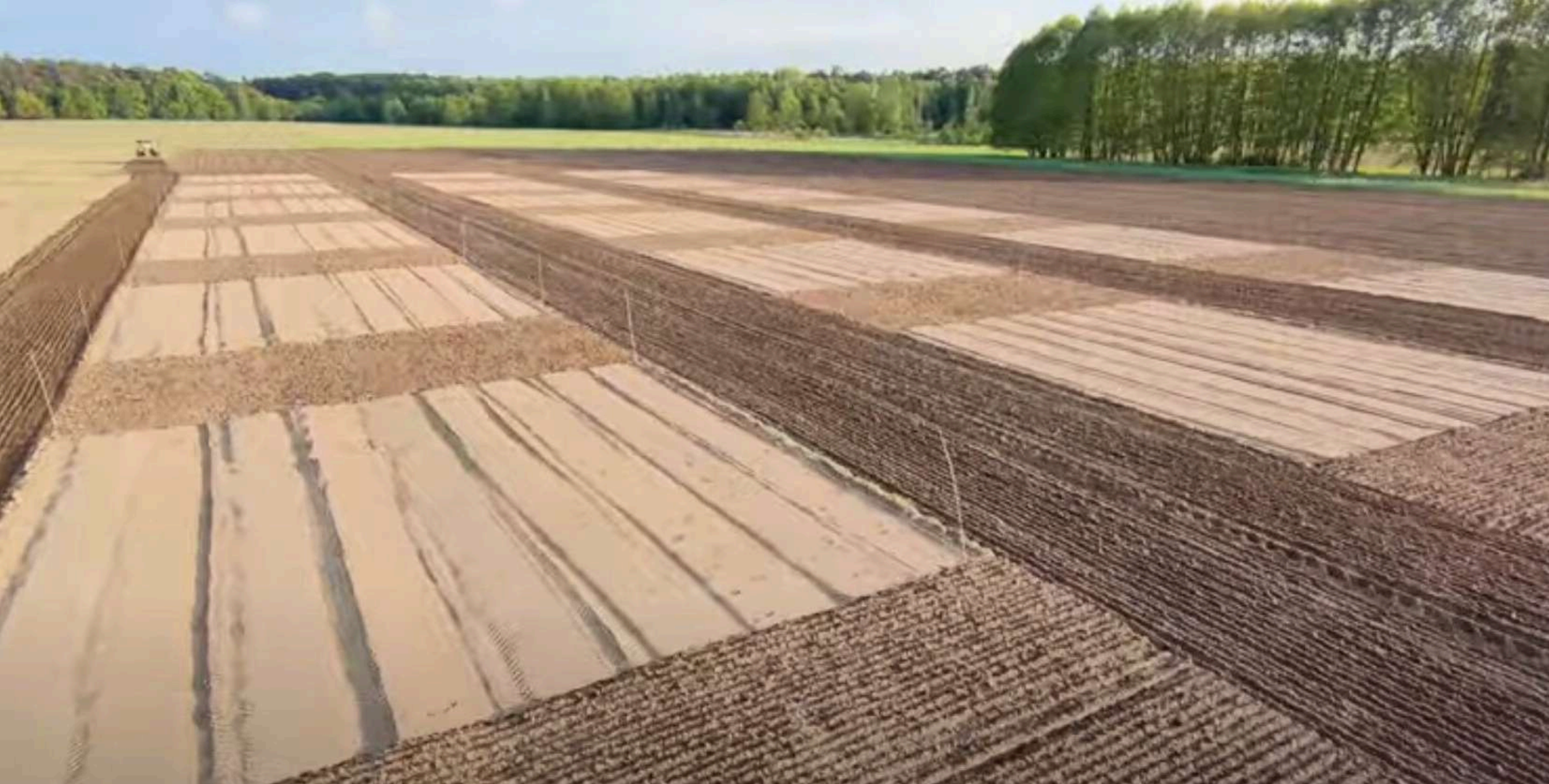
Glebowy Bank Węgla w Nieborowie: przygotowanie poletek doświadczalnych maj 2025