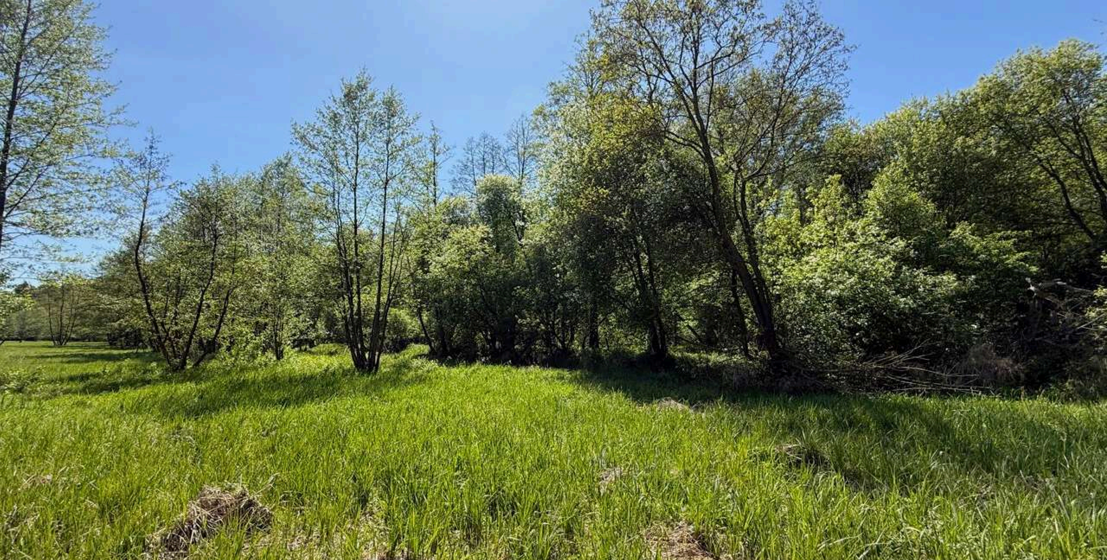
Prywatny Rezerwat łąki w Nieborowie, maj 2025